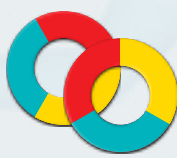
anillas para los policías