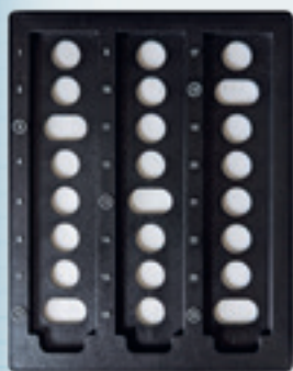
tabla de itinerario con papel