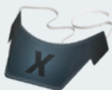
visera para Mister X