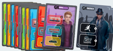
tablas para billetes