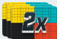
billetes de jugada doble